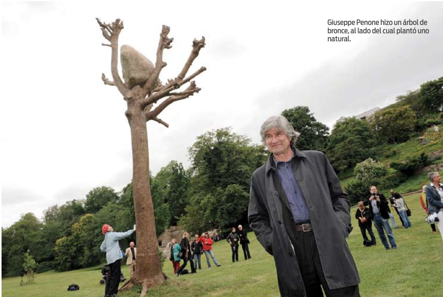
Giuseppe Penone hizo un árbol de bronce, al lado del cual plantó uno natural.